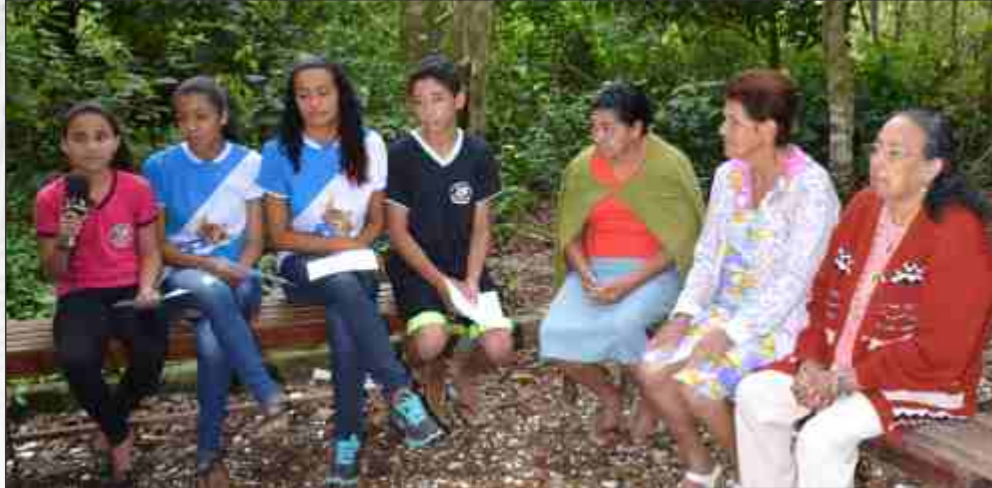
Visita a uma reserva ambiental de Barra Nova culminou com a entrevista com moradoras

Numa manhã ensolarada do dia 14 de abril, nossos jovens repórteres do Centro Educacional de Barra Nova estiveram numa reserva ambiental particular nas imediações de Barra Nova, para um bate-papo com antigas moradoras do distrito.