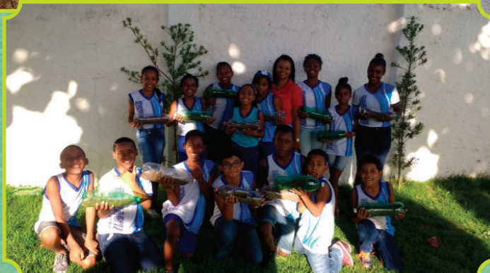
Confeção da Horta suspensa