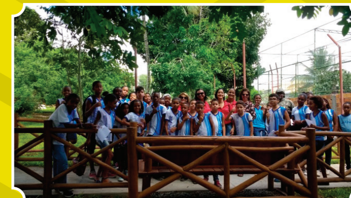
Visita ao ECO PARK Fauna Viva