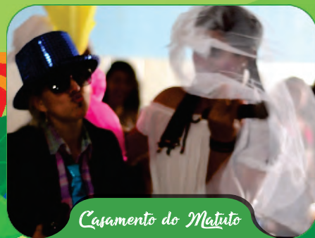
Casamento do Matuto

No pátio da escola, nas barracas (ornamentadas pelos alunos, como prova da gincana), foram servidas muitas comidas típicas.