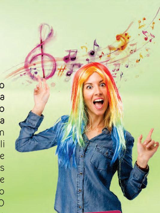
Projeto Dança da Disciplina Educação Física