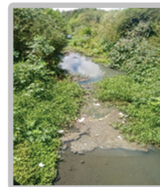
Av. Bartolomeu de Gusmão, onde termina a canalização do rio.

Visita dos alunos para conhecer o local 8º ano A, Setembro de 2017 Onde começa a canalização do rio.