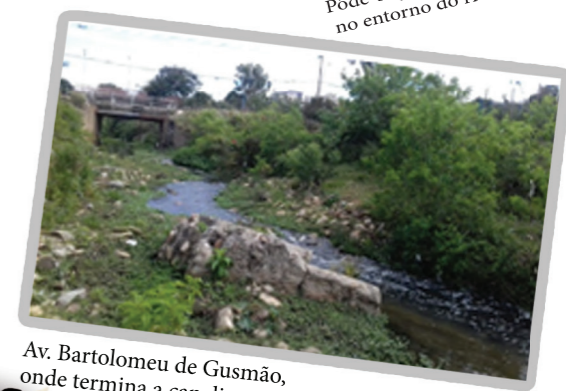
Av. Bartolomeu de Gusmão, onde termina a canalização do rio.