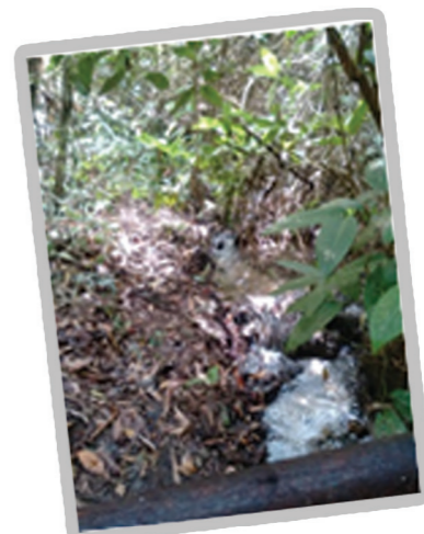
Rio no Poço Escuro