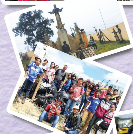
Atividades de aula de campo