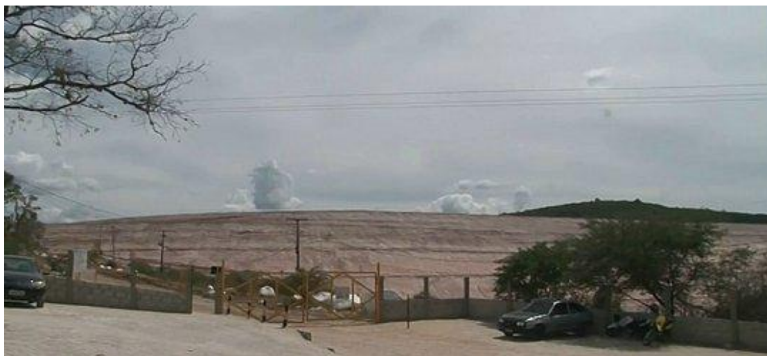
Moradores de Jacobina temem rompimento de barragem

As regiões baianas onde há exploração de mineração, por outro lado, são predominantemente planas. “Diminui esse impacto. Se você tem uma água em cima e cai, a gravidade vai ajudar. Se a água já está embaixo, ela também vai cair, mas a velocidade é bem menor do que se estiver no alto”.