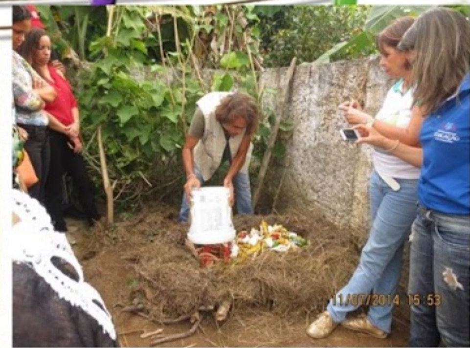
Oficina de compostagem para os professores