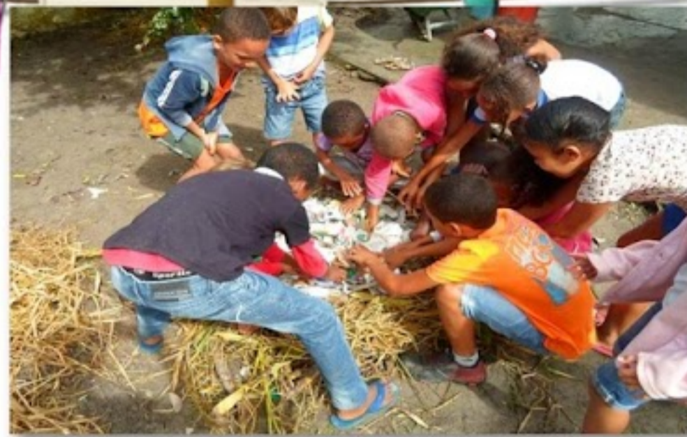
Escola Municipal Antônio A. C. de Albuquerque