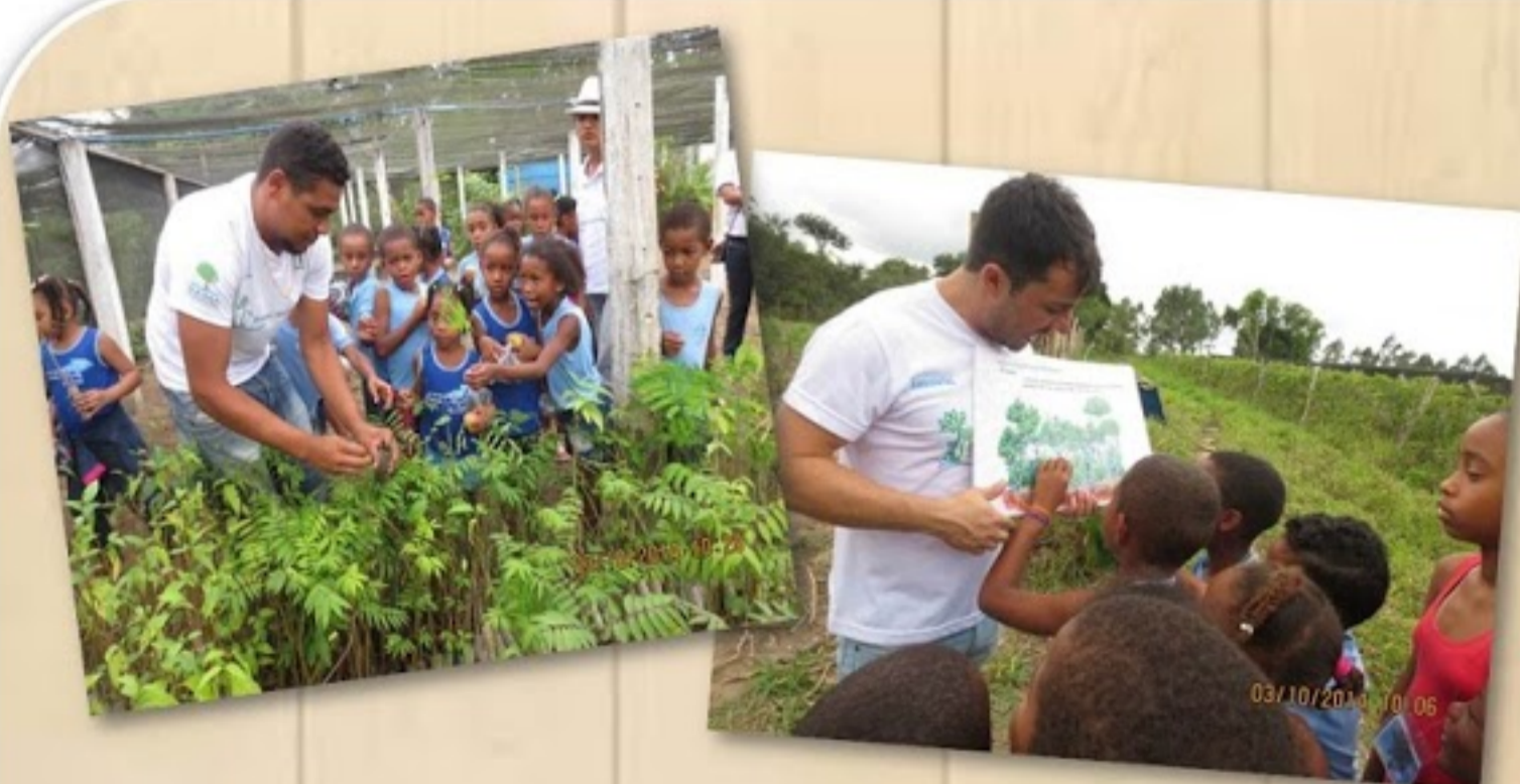
Alunos das escolas do Programa Despertar visitaram o Viveiro de Mudas do GANA