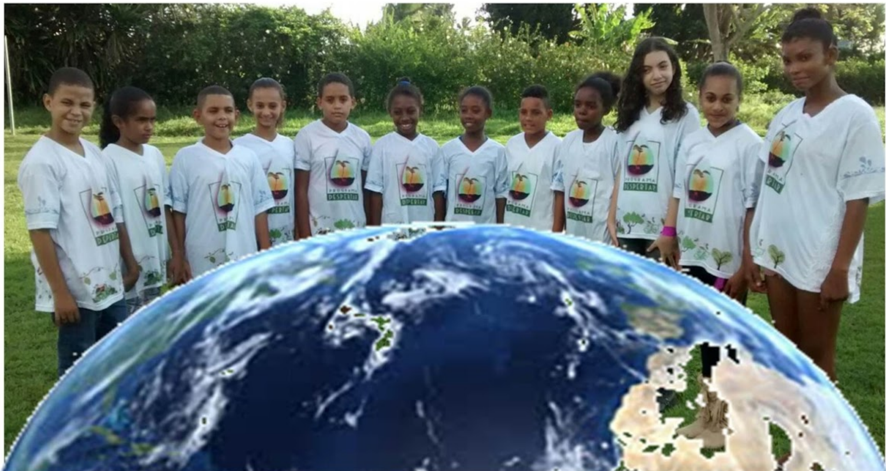
Alunos da Escola Municipal Antônio Araújo Costa de Albuquerque