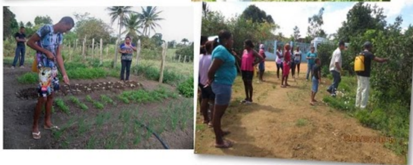
Oficina na Comunidade

Tema: Uso do biogel: uma alternativa de fertilizante natural e sustentável