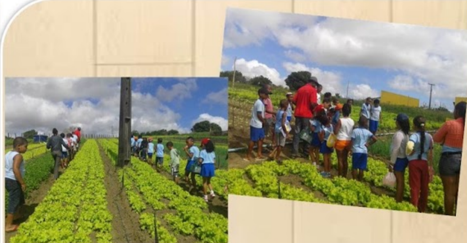
Alunos da Escola Municipal Anésio Leão visitam a horta orgânica da comunidade.