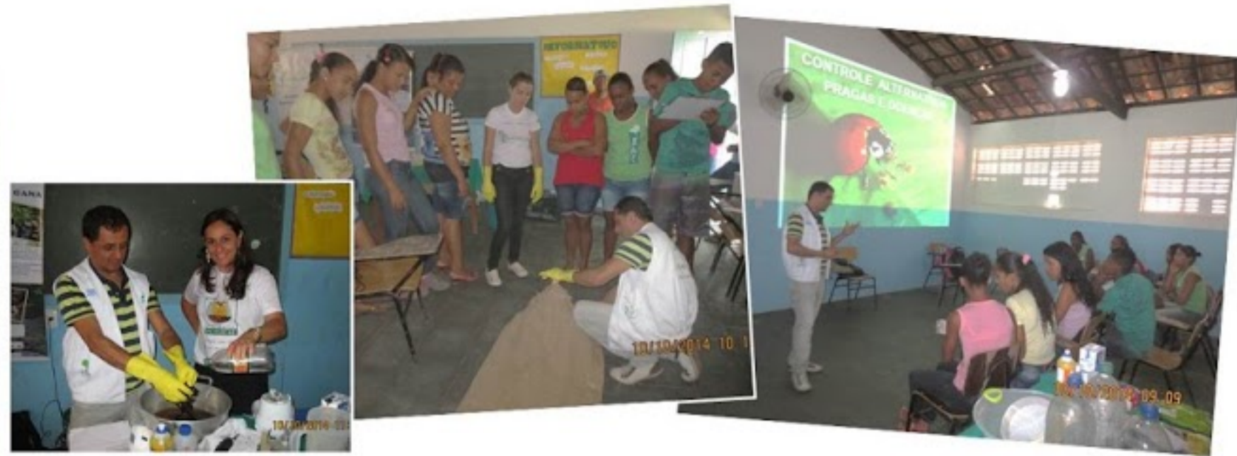
Oficina para estudantes da Escola Antonio Mateus em parceria com o GANA - Tema: Controle alternativo de pragas e doenças

O tema Defensivos Agrícolas Naturais é trabalhado de diversas formas nas escolas do Programa Despertar-SENAR-BA, em Santo Antônio de Jesus, com alunos e comunidades. O uso de agrotóxicos se expandiu muito e as consequências para a saúde humana e a vida do planeta são impactantes, por isso percebemos a grande necessidade de sensibilizar as comunidades para uma reflexão sobre essa temática e uma possível mudança de atitude. Palestras, oficinas e seminários são realizados através das ações do Programa no município, enfocando sempre a necessidade de substituição dos agrotóxicos por defensivos e fertilizantes naturais.