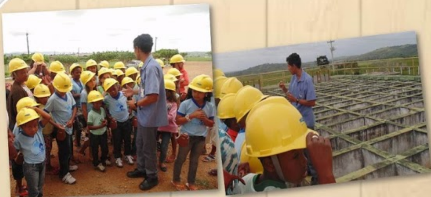
Alunos da Escola Macário Bispo dos Santos visitam a Estação de Tratamento da Água.