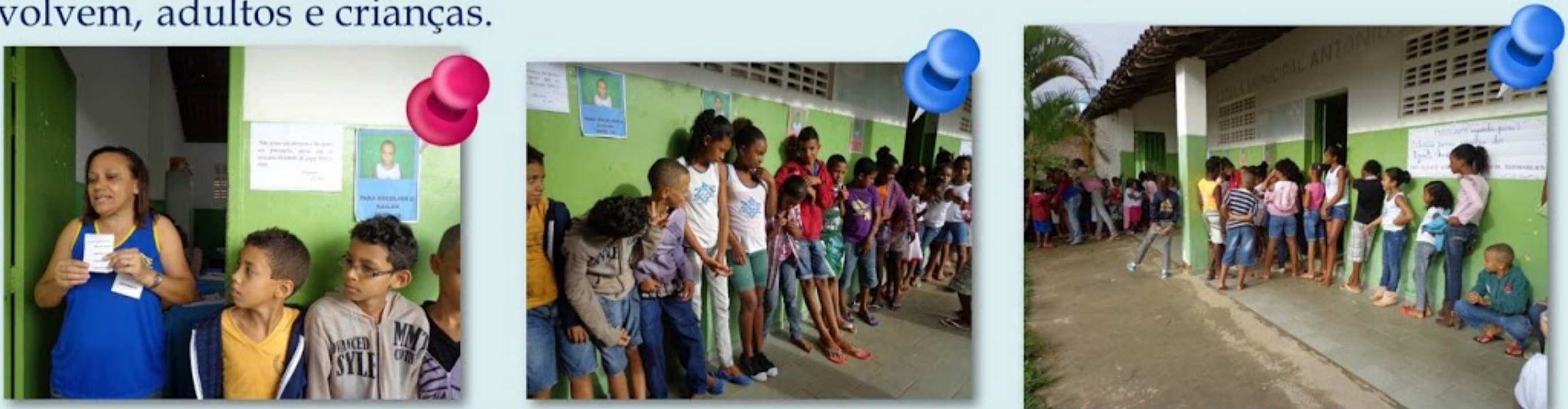
Eleição de Agentes DESPERTAR na Escola Municipal Antônio Araújo Costa de Albuquerque

O momento de escolha do Agente Despertar na escola é o momento de trabalhar valores, autonomia, tomada de decisão, responsabilidade na escolha, análise de proposta, vínculos, leitura, escrita, respeito, atenção, enfim, um momento mágico nas escolas onde todos se envolvem, adultos e crianças.