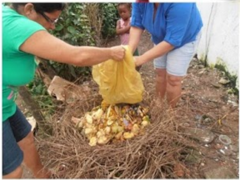
Escola Municipal Macário Bispo dos Santos