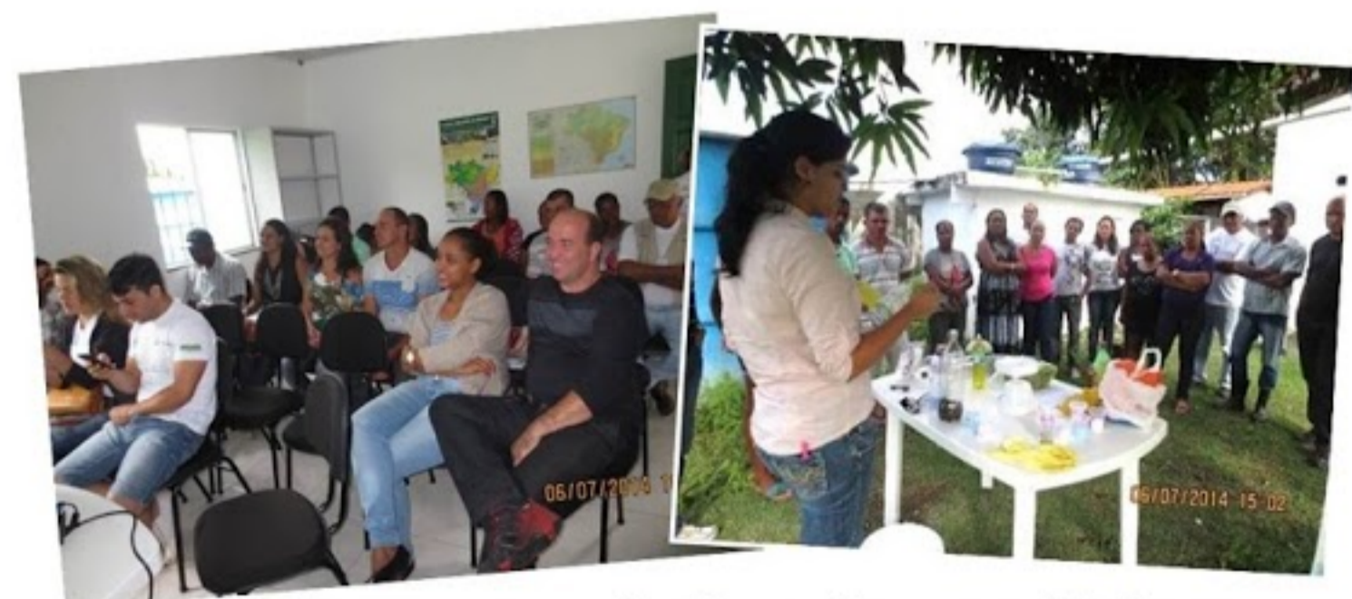
Curso para agricultores da comunidade em parceria com o GANA. Tema: Caldas

Tema: Uso do biogel: uma alternativa de fertilizante natural e sustentável