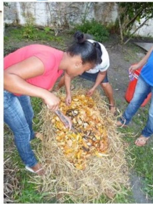
Escola Municipal Antônio Araújo Costa de Albuquerque