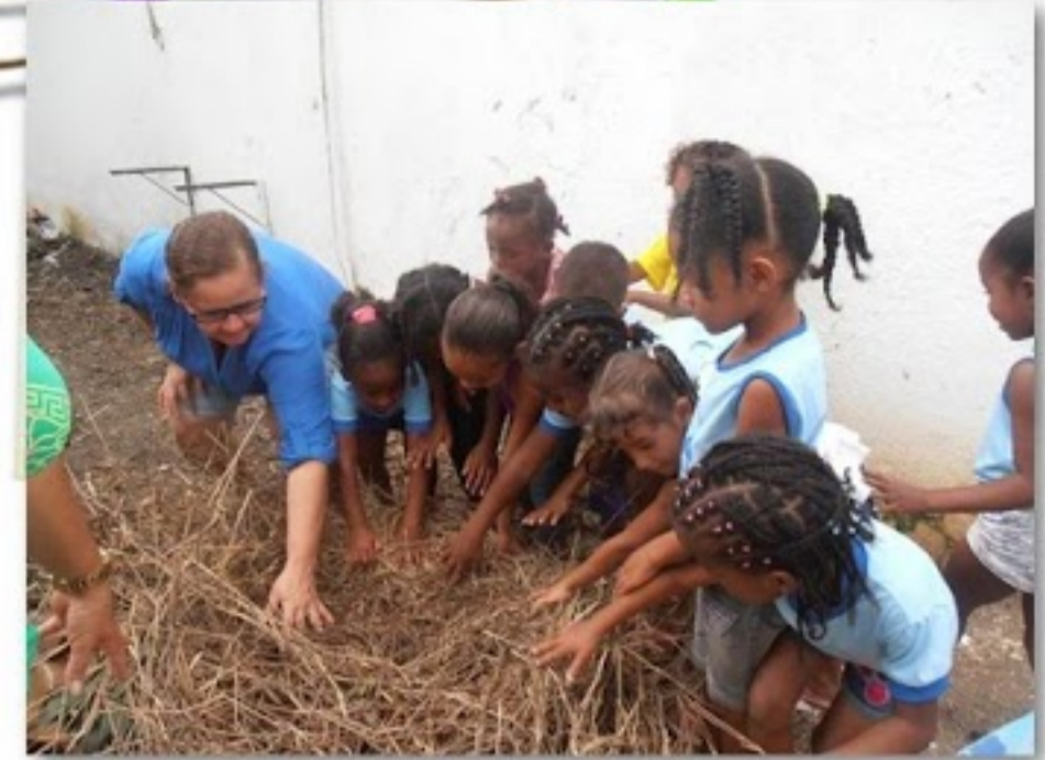
Escola Municipal Macário Bispo dos Santos

O trabalho com a Horta Escolar e a Compostagem na escola tem o objetivo de mobilizar crianças, adolescentes, professores, enfim, toda a comunidade, para o uso da horta como um processo de socialização e resgate social e educacional, além de implantar a Educação Ambiental de forma interdisciplinar e vivenciada, em que a natureza possa ser compreendida como um todo dinâmico e o ser humano, como parte integrante e agente de transformação do mundo em que vive.