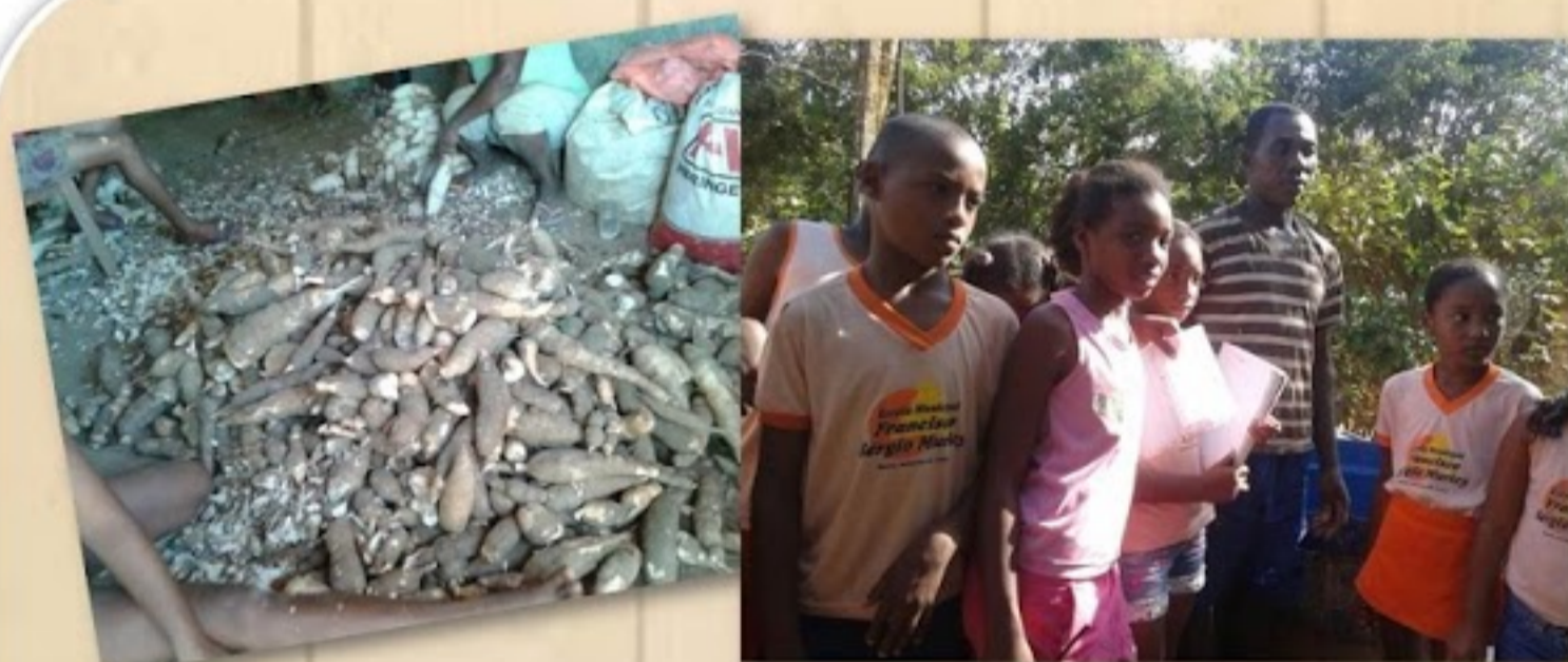
Alunos da Escola Municipal Francisco Sérgio Muricy visitam às casas de produção da carimã da comunidade.