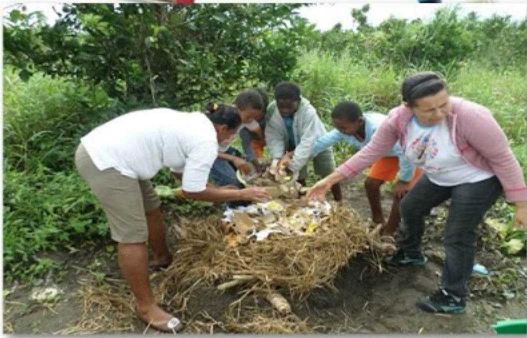
Escola Municipal Antonio Manoel Vieira