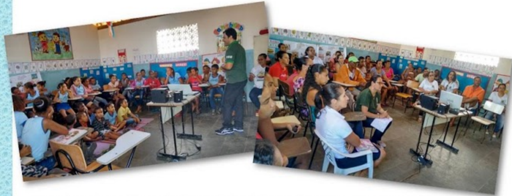
Seminário na Escola Municipal João da Cruz Souza com alunos e comunidade