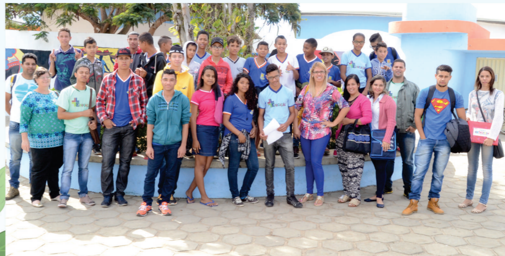
Atividade contou com a participação dos monitores do programa Mais Educação