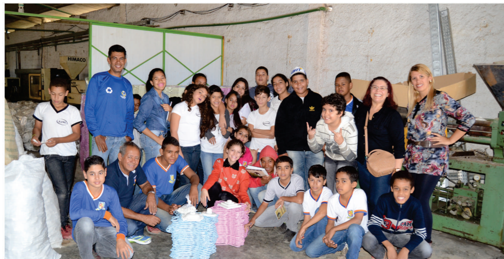
Aula sobre a reciclagem do lixo na usina de reciclagem do Projeto Recicla Conquista

Uma experiência incrível onde levamos uma turma do 7º ano Matutino a Vitória da Conquista afim de mostrar e conscientizá-los do grande volume de lixo que é reaproveitado e utilizado na recuperação e confecção de objetos que podem ser usados por todos nós.