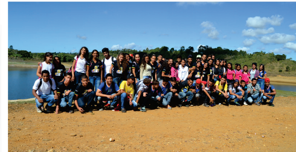
Aula de campo nas Barragens Água Fria I e II, realizada com as turmas de 9º ano do CEBC

Nós fomos visitar as Barragens Água fria I e II, com o intuito de observar e aprender sobre o que está acontecendo com a água da região de Barra do Choça e a crise hídrica das regiões vizinhas. Com isso, dia 31 de maio nós, alunos do 9º ano do Centro Educacional de Barra do Choça, buscamos nos conscientizar que é importante a preservação dessas áreas e levar esse aprendizado para as pessoas.