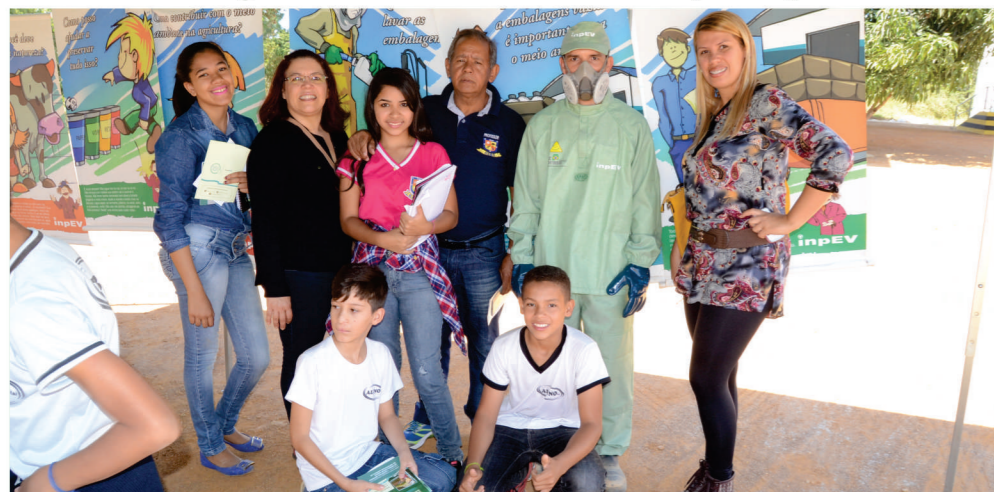
Alunos do CEBC visitam a Associação dos Revendedores de Agrotóxicos do Sudoeste (ARAS)

No dia 26/05 (quinta-feira), com o apoio da SEMED, alunos do 7º ano D do matutino do CEBC fizeram uma visita a indústria de reciclagem ARAS de Vitória da conquista. O objetivo da visita a Usina de Reciclagem é para conhecer o manejo dos resíduos sólidos da nossa região. Essa iniciativa visa à percepção dos alunos quanto a problemática do lixo, pois apenas conhecendo a realidade é que vamos percebendo a importância de colaborar, mudando os nossos hábitos.