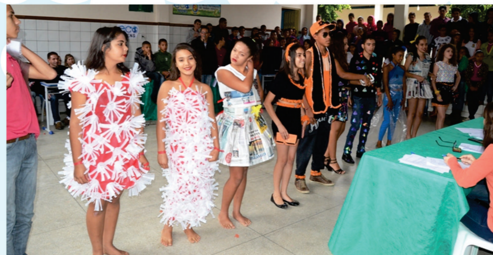
Alunos participaram de diversas provas como a de roupas feitas com materiais recicláveis

Nos dias 30 de junho e 01 de julho, foi realizada no Centro Educacional de Barra do Choça uma Gincana Ecológica, sendo esta uma das ações do Projeto Eco Teens, a qual esta Instituição teve o prazer de ser convidada a participar, vale ressaltar que o CEBC, foi uma das pioneiras na realização de projetos e ações que se remetem à questão ambiental, tendo como maior feito, a realização da 1ª Conferência Estudantil Ambiental do município.