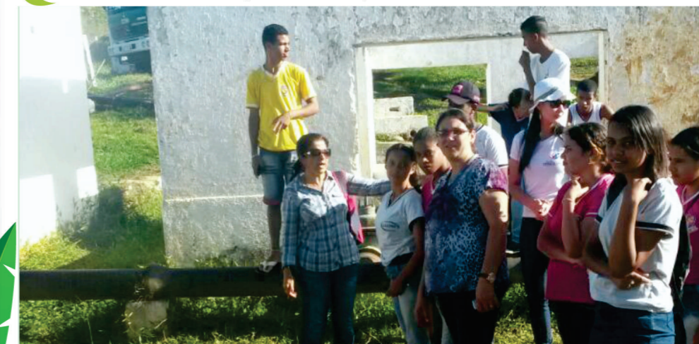
Visita ao bairro Bom Retiro, a Estação de Tratamento de Esgoto, o rio da Passagem e Biquinha