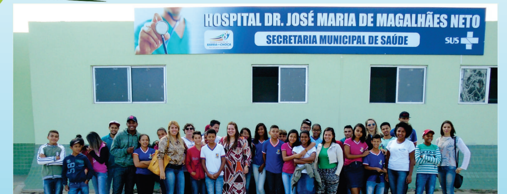
Alunos descobriram como é feito o descarte do lixo hospitalar em Barra do Choça

Algumas expressões tem se tornando recorrentes em nosso dia a dia como "sustentabilidade", por exemplo. Nunca se apregooou tanto os conceitos de reutilização e reciclagem de materiais. Porém, quando pensamos em reciclagem dificilmente pensamos no chamado "lixo hospitalar", não é mesmo?